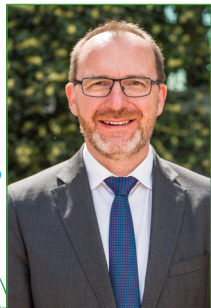
Georges ENGEL Député-maire/Bürgermeister

Mit Freude, Begeisterung und Tatendrang stellen wir das "Umweldiplom 2018" mit Aktivitäten vor, die sich an alle Schüler der Zyklen 3.2 und 4.1 des Schuljahres 2017/2018 richten.