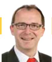
Georges Engel Buergermeeschter