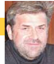
Alain Cornély Präsident vun der Sportskommissioun