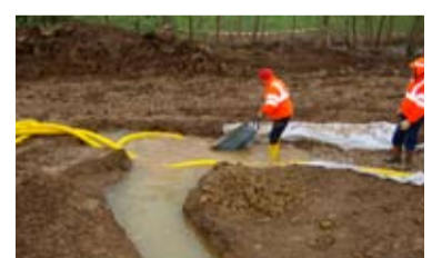
Travaux de drainage