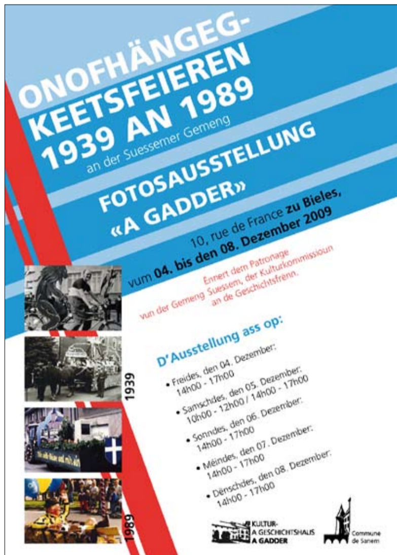
Affiche de l'exposition «Onofhängegekeetsfeieren 1939 an 1989 an der Suessemer Gemeng»

Son bagage ainsi complété, l'historien sera parfaitement armé pour s'atteler aux multiples tâches qui l'attendent, dont en premier lieu une conservation des archives selon les règles de l'art, ce qui demande des techniques bien spécifiques. Parmi celles-ci, une des plus importantes est la saisie électronique des pièces d'archives, qui ne peut être effectuée correctement sans la maîtrise des outils – matériel et logiciels – destinés à cet effet.