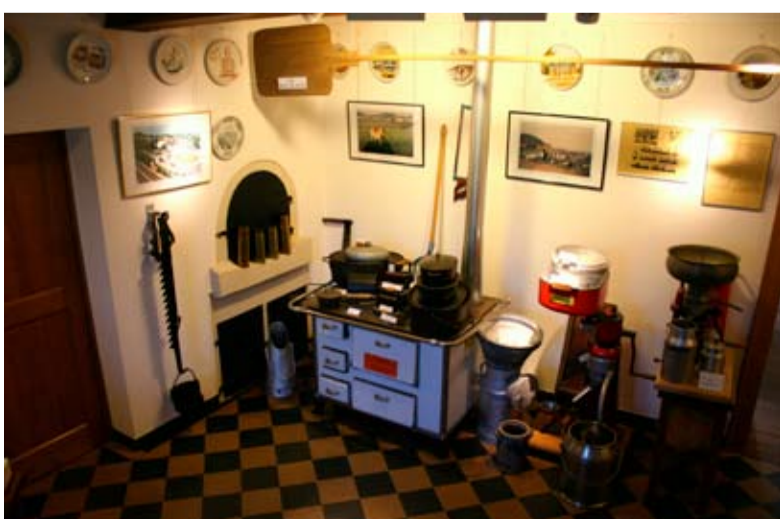
Vue partielle sur une ancienne cuisine dans la partie musée de la maison