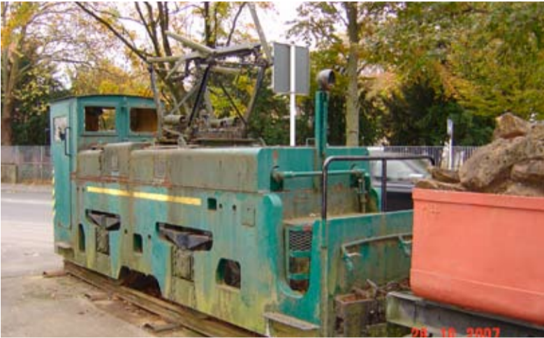
Avant les travaux de restauration

RESTAURATION DE L'ANCIENNE LOCOMOTIVE À BELVAUX