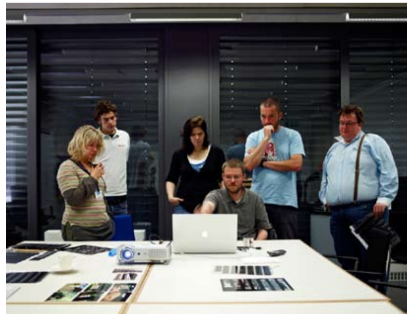
Cours de photographie au CNA (Centre national de l'audiovisuel)