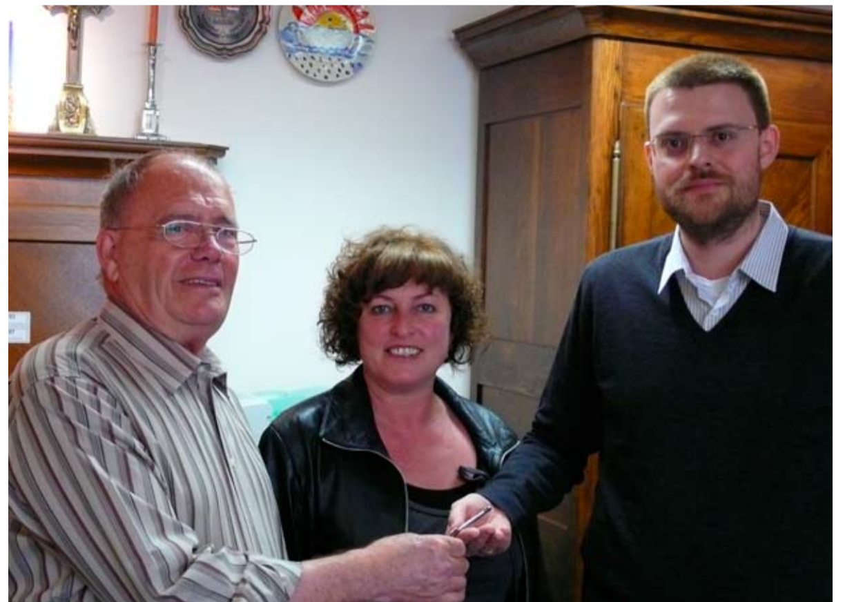
Remise de clés à la Maison A Gadder