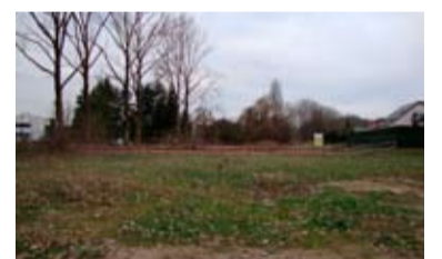
Le terrain de 50 a en novembre 2009