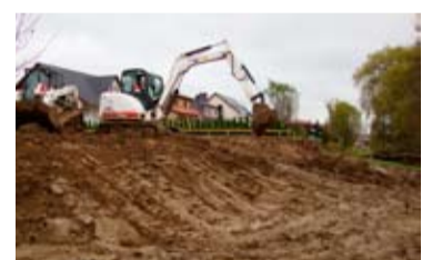
Début des premiers travaux d'excavation