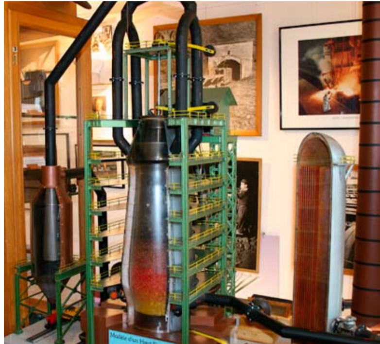
Reproduction miniature d'un haut-fourneau