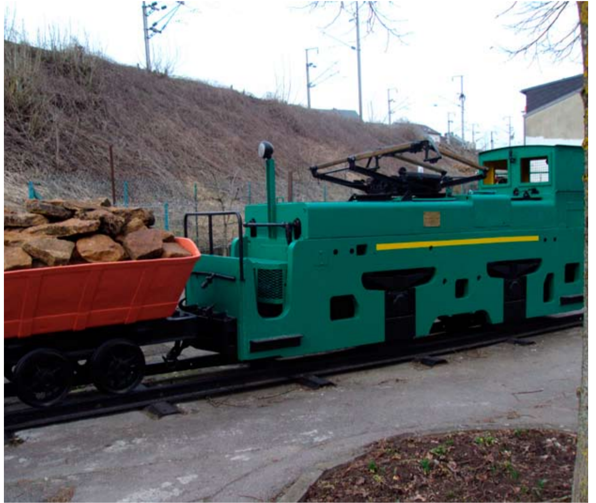
L'ancienne locomotive dans son nouveau look