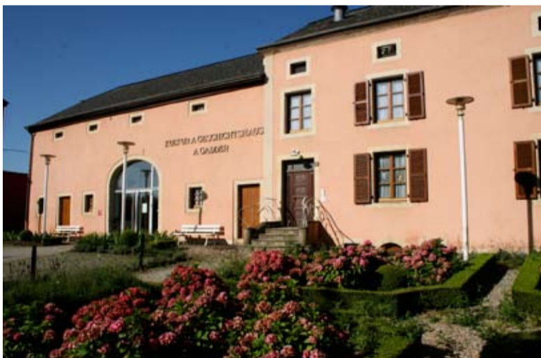
Façade avant de la Kultur- a Geschichtshaus A Gadder (Maison culturelle et historique A Gadder)