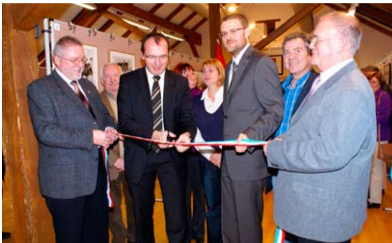
Ouverture officielle de l'exposition «Onofhänggekeetsfeieren 1939 an 1989 an der Suessemmer Gemeng» (Fêtes d'indépendance 1939 et 1989 dans la commune de Sanem) le 3 décembre 2009 à la Maison A Gadder